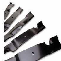
Grasshopper Grassmax terävalikoima