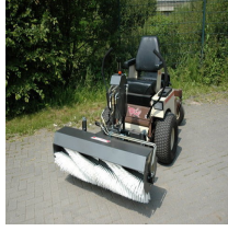
Grasshopper hydraulinen avoharja