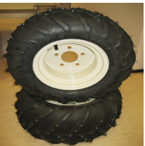
Grasshopper nastarenkaat / ketjut