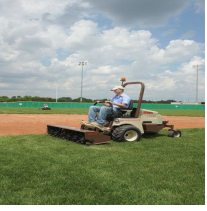
Grasshopper AeraVator ilmastin