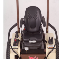
Grasshopper Grammer terveysistuin