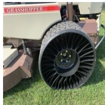
Grasshopper_Michelin Tweel pyörät