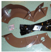
Grasshopper Bioclip - allemurskaus