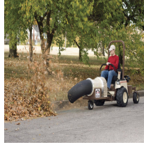
Grasshopper Buffalo Turbine suurtehopuhallin