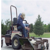
Grasshopper käännettävä sivuluukku/sulku