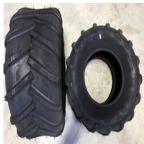
Grasshopper etuleikkurimallien rengasvaihtoehdot