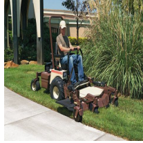
Grasshopper reunaleikkuri EdgeEze