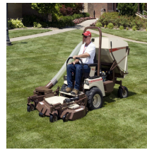
Grasshopper M15B kerääjä