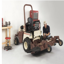
Grasshopper PowerFold huoltoasentoon nosto