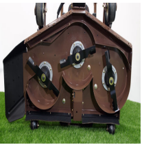
Grasshopper 33,34 ja 36-sarjan sivullepurkava leikkuulaite