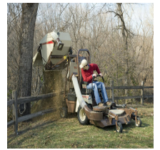
Grasshopper B15 HL korkeanosto