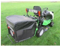
Etesia H100 III lisävarusteet